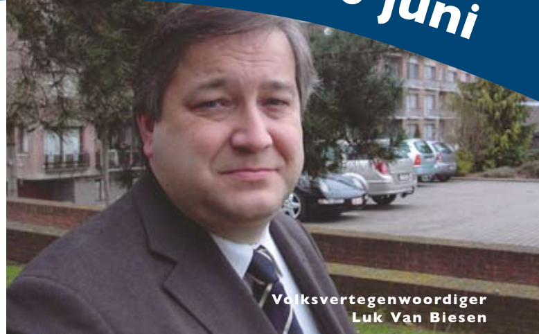
Volksvertegenwoordiger Luk Van Biesen

Onlangs schreef de Standaard dat "ge Luk Van Biesen moet kennen omwille van zijn deskundigheid op het vlak van de fiscaliteit en zijn inzet voor het invoeren van de dubbele boekhouding in de publieke sector". De Nederlandstalige en Franstalige pers publiceren vaak zijn bijdragen over de financiering van de overheid, over de staats-hervorming en over specifieke toestand in de rand rondom Brussel. Op twee en een half jaar tijd dwong Luk Van Biesen respect af bij vriend en vijand. Zelfs in die mate dat niet minder dan vier partijen