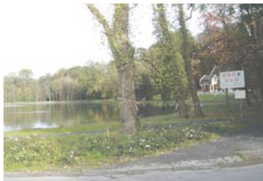
Wandelaars en vissers komen terug aan hun trekken bij de vernieuwde Jourdainvijver.