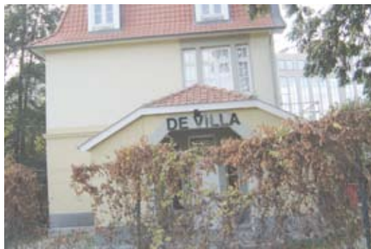
Het jeugdhuis werd volledig opgesmukt en mag gezien worden.

✓ Over de restauratie van “De Villa” werd al zeer lang gepraat, maar de uitvoering van de plannen liet op zich wachten. Binnen het schepencollege slaagde Luk Van Biesen erin om zijn collega’s te overtuigen tot de actie over te gaan. Het resultaat mag gezien worden.