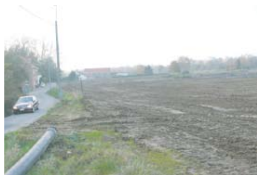
Over een paar jaar zal dit veld volledig groen kleuren.