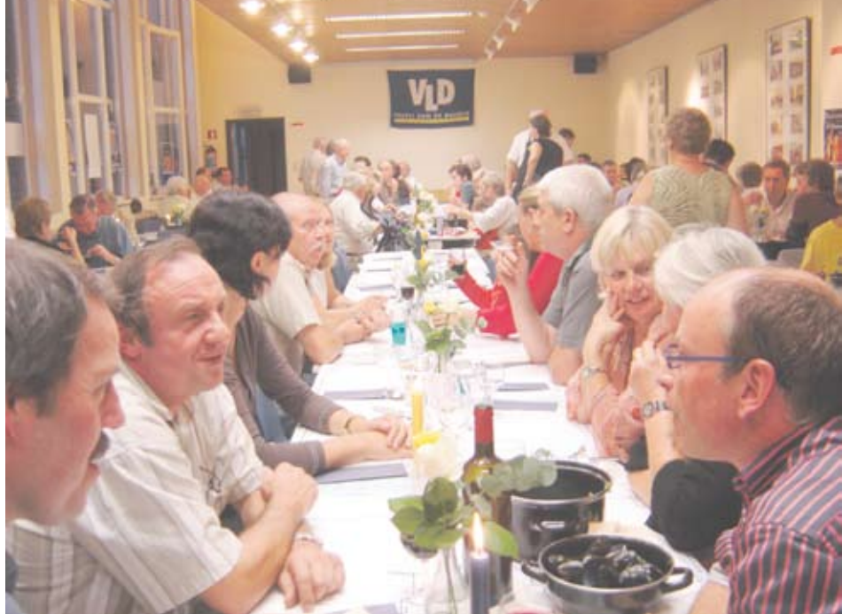
Twee dagen na elkaar een bomvolle zaal: ons eetfestijn was geslaagd!

Ons 21 ste eetfestijn in Cammeland te Kraainem is ook voor de 21 ste keer een succes geworden. Het Librado- en VLD-bestuur had deze keer gekozen voor een totaal andere formule. Daar waar vroeger voorgerecht en hoofdschotel op het menu stonden werd nu geopteerd voor lekkere Zeeuwse mosselen