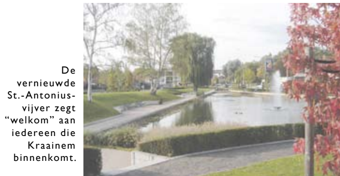
De vernieuwde St.-Antoniusvijver zegt “welkom” aan iedereen die Kraainem binnenkomt.

✓ Het restaureren van de St.-Antoniusvijver sleepte ook al jaren aan. In de loop van de jaren ‘90 had Louis Hereng (toen raadslid) de zaak al meermaals aangekaart op de gemeenteraad, echter zonder resultaat. In 2001 trok hij met de betrokken schepenen ter plaatse en die stelden vast dat het inderdaad de hoogste tijd was de vijver te restaureren. Vandaag moet iedere voorbijganger beamen dat het resultaat er mag zijn.